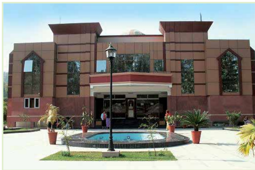
Prakash Deep Institute of Ayurvedic Sciences, de kliniek en het stagecentrum in Raiwala, India